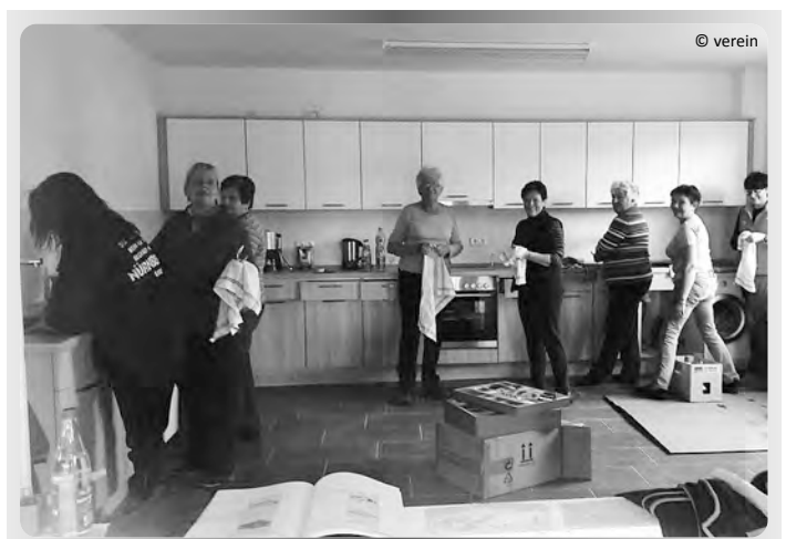
TSG Damen bestücken die Küche

Wie berichtet stehen am 24.07.2016 ab 10:00 Uhr die Einweihungsfeierlichkeiten der neuen TSG Sporthalle an. Neben dem Jugendraum, Umkleide-, Dusch- und Wellnessbereichen, den Sanitär und der vorbereiteten neuen Saunazone steht die Sporthalle im Zentrum des Gebäudes. Zu den TSG Hallensportaktivitäten werden die Räume auch für Vereinsveranstaltungen und Versammlungen der TSG genutzt. Zur Verbesserung der Ellinger Möglichkeiten bietet die TSG zur Durchführung von Firmen- Vereins- und privaten Familienfesten die neue Halle zur Anmietung an. Die Küche bietet reichlich Geschirr und Gläser, für die Halle im OG sind für ca. 160 Personen ausreichend Tischen und Stühlen vorhanden. (gf)