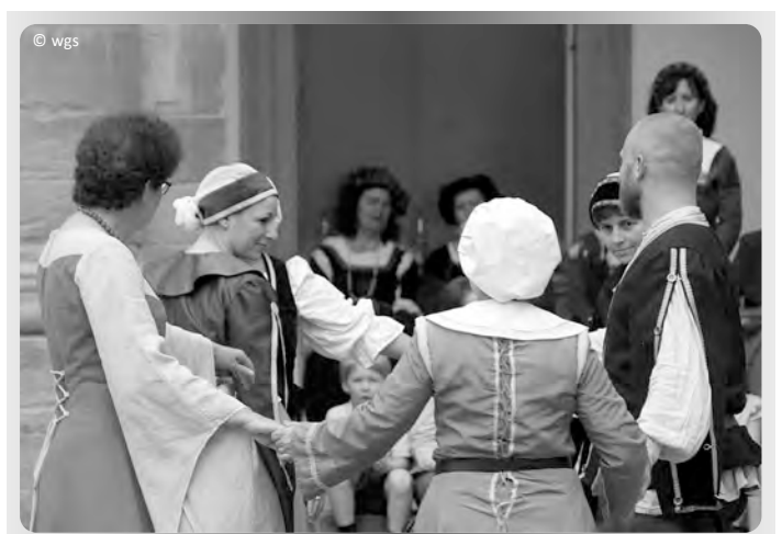
Manch einer schwang mit Begeisterung das (historische) Tanzbein