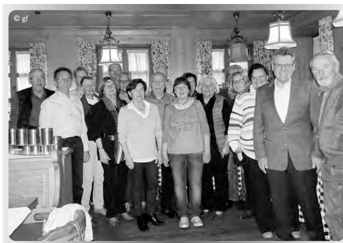
Gruppenbild einer Seniorenberater-Ausbildung