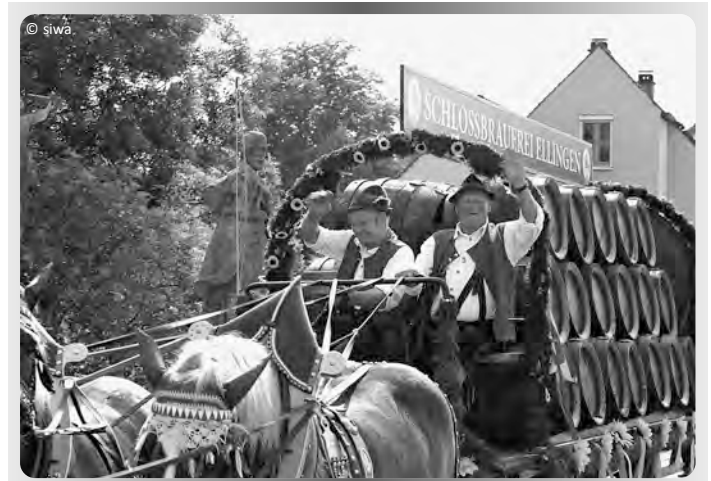
Festzug mit dem Bierwagen

Mit der Heiligen Messe, die bei schönem Wetter um 10 Uhr im Brauereihof stattfindet, beginnt der Sonntag. Im Anschluss – um 11 Uhr – sind alle Besucher zum Jazz-Frühschoppen mit Wolfgang Höhn und seinem Trio eingeladen. Der Sternmarsch im Rahmen von „800 Jahre Deutscher Orden in Ellingen“ mit drei Blaskapellen in historischen Uniformen beginnt um 13 Uhr. Die Deutschordens-Kapelle Ellingen eröffnet den Sternmarsch zum Schloss vom Rathaus kommend. Von der Stadtpfarrkirche aus wird die Knabenkapelle Nördlingen durch die Weißenburger Straße zum Schloss aufmarschieren. Als dritte Formation wird die Dinkelsbühler Knabenkapelle von der Ringstraße aus durch die Allee auf das Schloss zu marschieren. Ungefähr 150 junge Musiker werden sich vor der Residenz zu einem großen, farbenprächtigen Gesamtbild zusammenfügen. Nach den Einzelstücken der Kapellen, wie zum Beispiel dem „Coburger Marsch“ oder dem „Frankenlied“, gibt es dann für alle Liebhaber der Blasmusik einen besonderen Höhepunkt. Aus Anlass des 40-jährigen Jubiläums der Deutschordens-Kapelle kommt der Bundesdirigent des