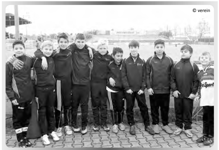
TSG U13 Jugend mit dabei

Wieder einmal hat eine Jugendmannschaft der TSG Ellingen in Wien bei einem internationalen Fußballturnier des Eurosportrings mit 10 Spielern der U13 mit 2 Betreuer und 7 Eltern teilgenommen. Die Fahrt war mit einigen Hindernissen gespickt. Zu spät im Hotel angekommen - kein Abendessen mehr bekommen - dann auf zum McDonalds, was zum bleibenden Jugenderlebnis für die Kids wurde. Im hervorragenden Spotgelände in Gerasdorf bei Wien trafen sich Auswahlmannschaften aus Weiden, Wr. Viktoria, eine Ungarische Auswahl OMTK ULE 1913, der Wiener Meister und Gastgeber Gerasdorf mit den Ellinger Jungs. Die Teilnahmefreude und Einsatzfreude steigerte sich von Tag zu Tag. Die Eltern erkundeten unterdessen die Sehenswürdigkeiten Wiens.