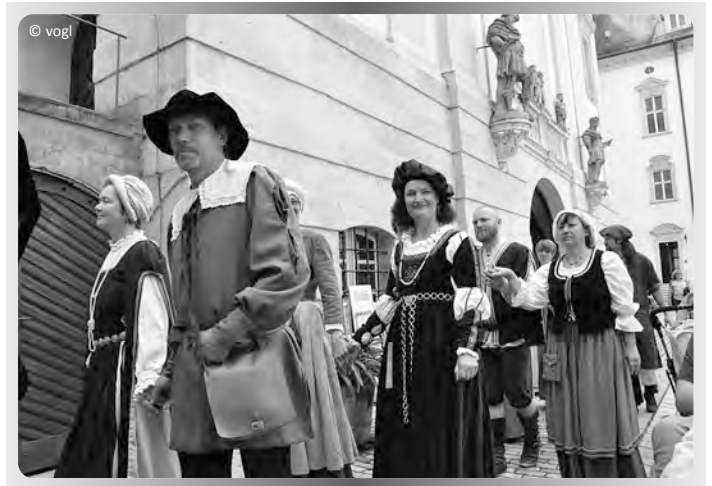
Einzug der historischen Musikgruppen

Die Bewirtung durch die Kolpingsfamilie Ellingen und zwei Mitmach Tänze für das Publikum lockerten den Nachmittag zusätzlich auf. (sv)