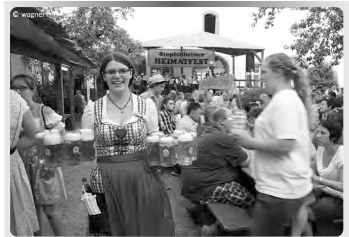
Ausschank im Innenhof der Deutschordens-Vogtei

Der Heimatfest-Ausschuss und alle Stopfenheimer freuen sich auf drei tolle Tage im herrlichen Ambiente des Deutschordens-Schlusses. Rechtzeitig zum Fest sind auch die Arbeiten am neuen Radweg nach Massenbach fertiggestellt worden, so dass man jetzt sicher und bequem nach Stopfenheim radeln kann. (cw)