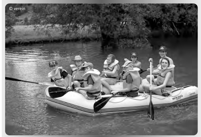
Bootsfahrt auf der Altmühl