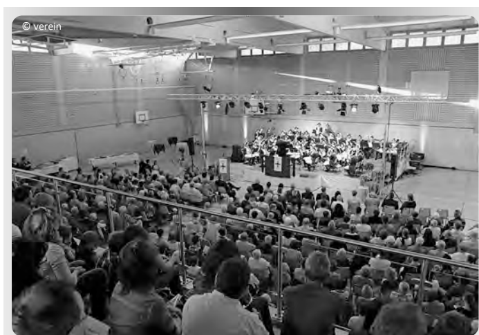
Jubiläumskonzert am 7. Mai in der Großen Ellinger Schulturnhalle