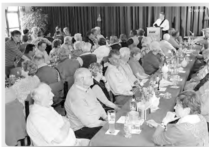
Unterhaltungsprogramm am Muttertag