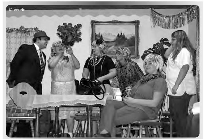
Die Kolping-Theatergruppe in Aktion

Friedhelm möchte bei seiner Freundin Doris einen guten Eindruck hinterlassen, doch seine Familie ist eine einzige Katastrophe. Willi bringt als Computerhacker Finanzwelt und Politik durcheinander, Hubbi erfindet Dinge, die niemand gebrauchen kann und seine Schwester Hermine schwebt in übersinnlichen Sphären. Bei einer Séance versucht Hermine das Liebesleben ihrer Freundin Gundula vorauszusagen. Doch leider kommt es anders als gewollt. Auch Gerd und Traudel (sie darf keinen Alkohol trinken), Freunde von Friedhelm, bringen dessen Pläne vom grundsoliden Leben durcheinander. Als dann auch noch Willi einen Job als Leichenwagenfahrer annimmt, ist das Chaos perfekt. (ee)