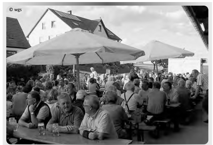
Zahlreiche Gäste aus Ellingen und den Bachgemeinden kommen gerne zum Feiern nach Massenbach