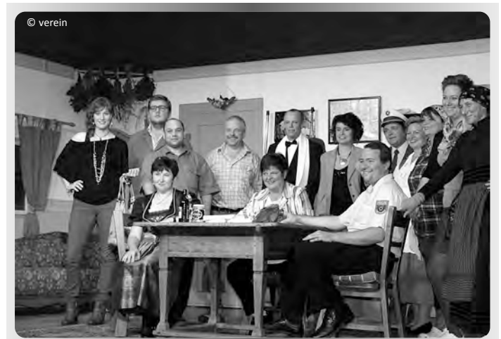
Gruppenbild nach erfolgreichem Auftritt