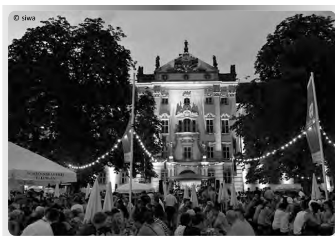
Feststimmung am Abend