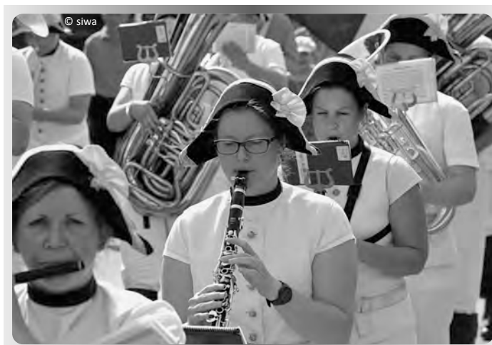
Drei Kapellen marschieren vor dem Schloss auf