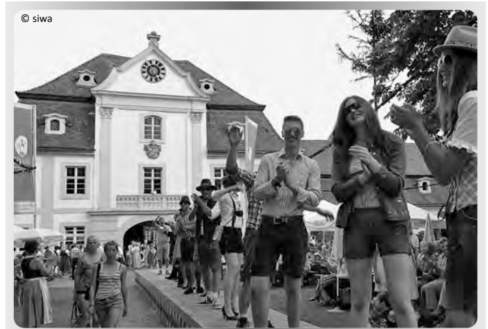
Trachten-Modenschau von „Päckert's“