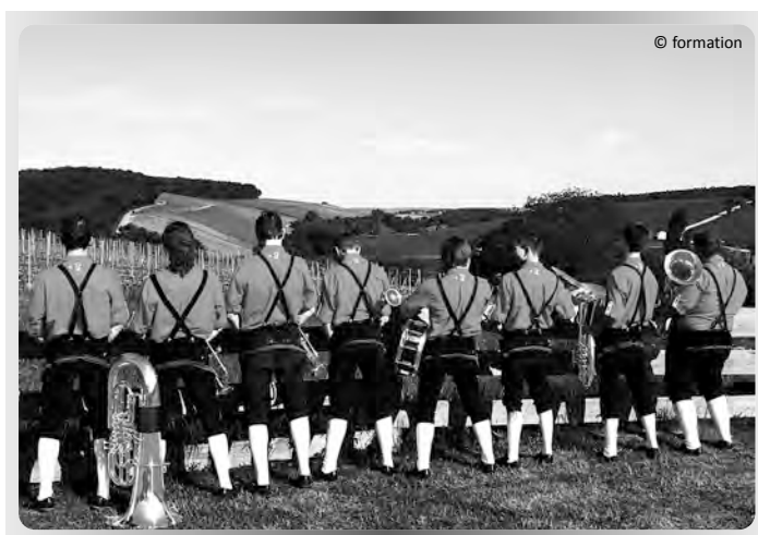
Blasmusik-Konzert mit „Meeblech“

Weitere Infos im Internet: http://800jahredo.ellingen.de