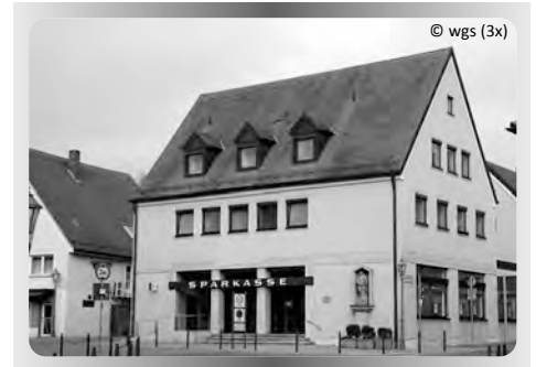
v .l.: Raiffeisenbank Ellingen, Raiffeisenbank Stopfenheim, Sparkasse Ellingen