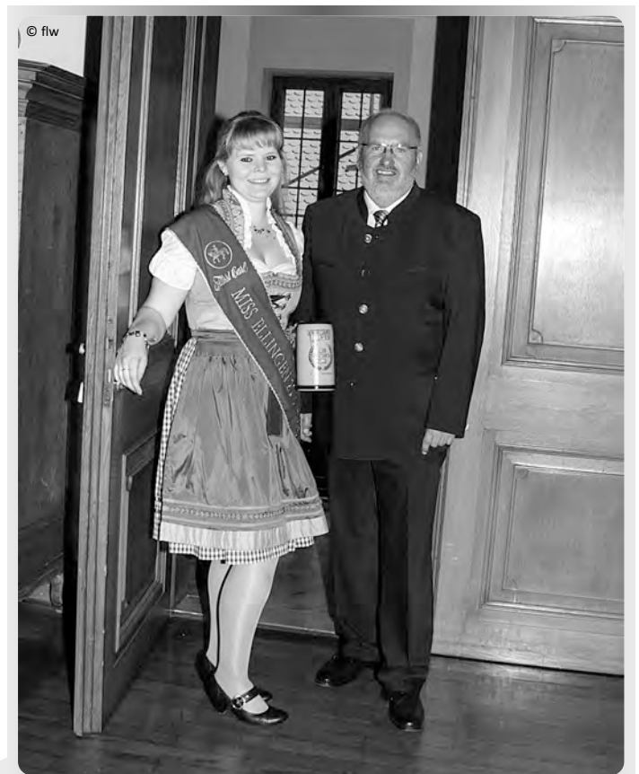
...zusammen mit dem 1. Bürgermeister Walter Hasl