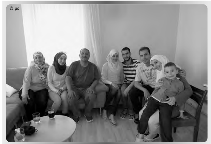
Die Flüchtlingsfamilie in ihrem neuen Zuhause