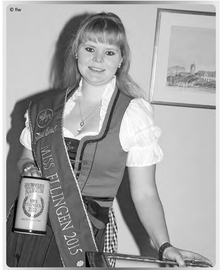
Die amtierende Miss Ellingen...