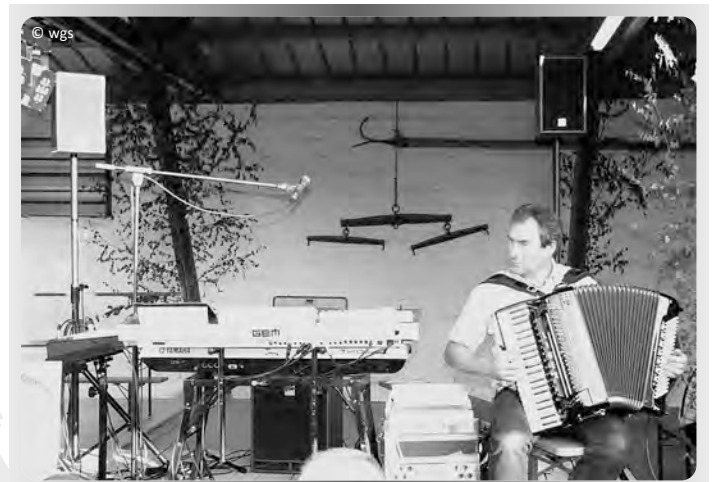
Für gute Stimmung ist gesorgt!