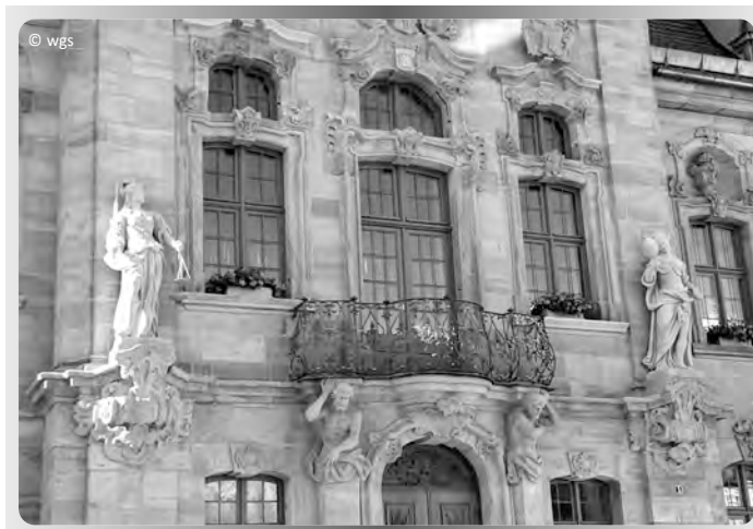
Alte Figuren in neuer Pracht - Justitia und Prudentia am Rathaus