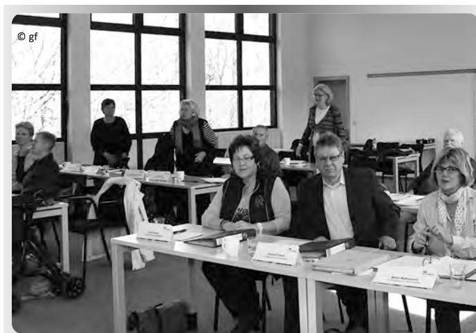
Ausbildungs-Seminare sorgen für das nötige Wissensspektrum