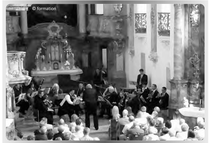
Barockmusik beim Ellinger Schlosskonzert

Zurück zur Musik. Das traditionelle Ellinger Schlosskonzert ist auch 2016 eines der zentralen Highlights im Jubiläumsjahr. Die Konzertbesucher erwarten am 10. Juli 2016 (Beginn: 15:30 Uhr) weltliche Kantaten und Violinkonzerte von Johann Sebastian Bach, ein großer Barockkomponist und einer der größten Musiker der