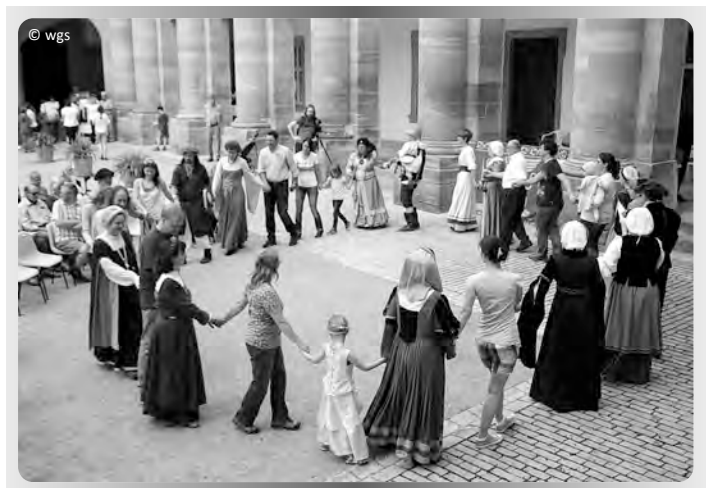
Mitmach-Tänze für Groß und Klein