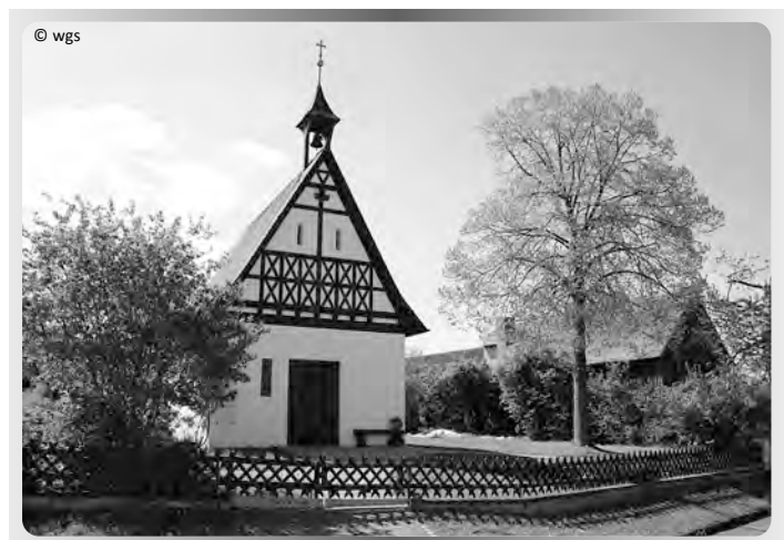
Die Oekumenische Kapelle von Massenbach