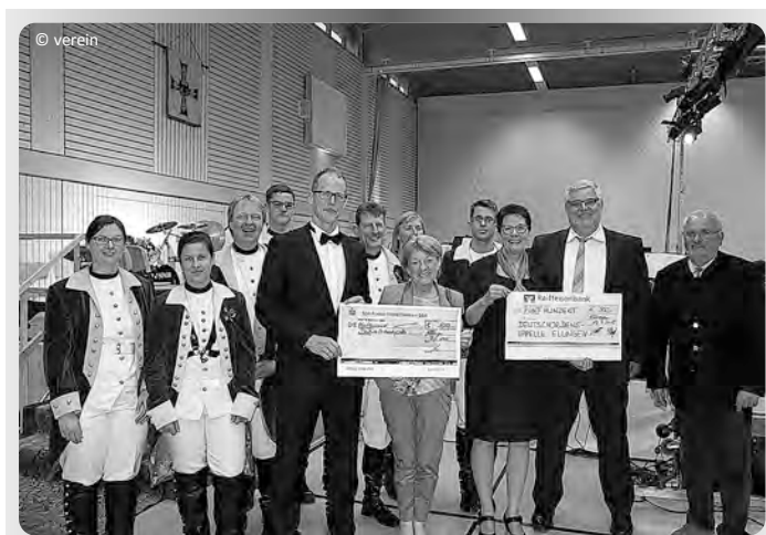
Spendenübergabe mit den beiden Ellinger Banken