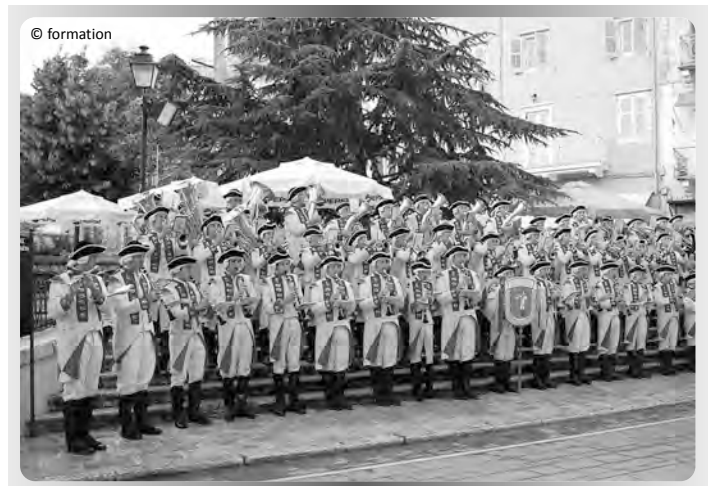
Die Knabenkapelle Dinkelsbühl kommt zum Sternmarsch