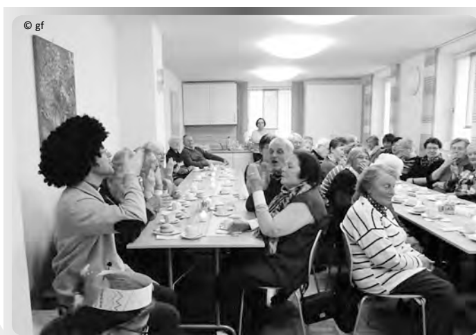
Gemeinsam mehr erleben - im Stopfenheimer Senioren-Treff