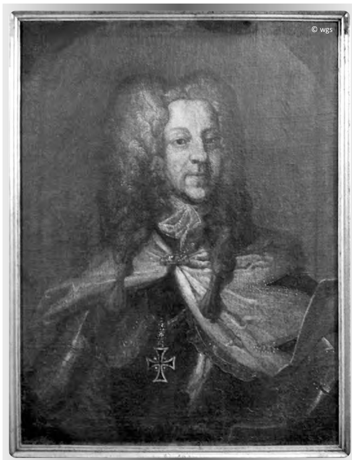
Ausstellung „800 Jahre Deutscher Orden in seiner Residenz Ellingen“

Den Schlusspunkt setzt am 12. November 2016 (Beginn 19:30 Uhr) die Deutschordens-Kapelle Ellingen mit ihrem Blasmusik-Konzert in der Großen Ellinger Schulsporthalle. Zu ihrem 40-jährigen Jubiläum macht sich die Deutschordens-Kapelle selbst ein Geschenk und hat die Musikgruppe „ Meeblech “ aus Unterfranken zu einem Gemeinschaftskonzert der Blasmusik eingeladen. Vorgetragen werden u.a. Stücke aus der böhmischen Blasmusik und viele bekannte Melodien von Ernst Mosch. (ms)