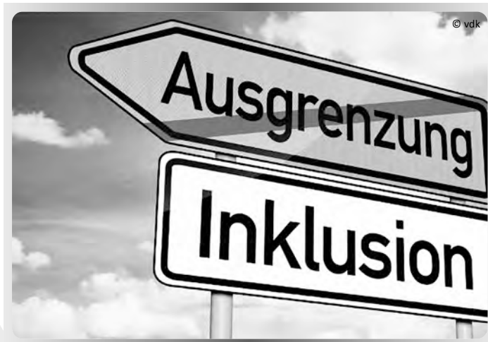
1. Öffentliche Inklusionsveranstaltung des VdK Ellingen

Sozialverband VdK, Ortsverband Ellingen Partner in Sozialrecht und Sozialpolitik www.ellingen.de > Vereine > VdK - 450 Mitglieder* *Bevölkerungsanteil von 12% incl. der Ellinger Ortsteile