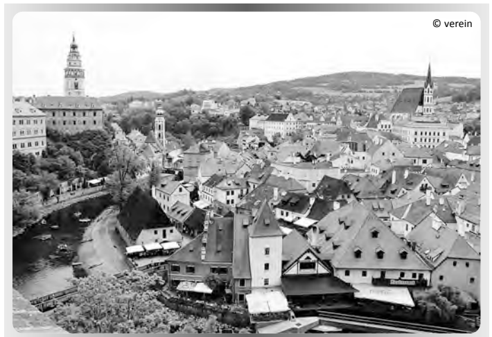
Altstadt Krumau mit Moldauschleife

Neben den ganzjährigen sportlichen Aktivitäten ist die Kegelsparte der TSG 1893 die „Gemütlichen 1958 Ellingen“ auch spezialisiert auf gemeinschaftliche - verbindende Unternehmungen. Aktuell war Kultur angesagt mit mehreren Tagen in Südböhmen. Über Linz und Freistadt ging es durch die Landschaft des Böhmerwalds zur Bierstadt Budweis mit einem zünftigen Bierabend, und von dort weiter nach Schloss Frauenberg zur Perle Böhmens - Krumau - mit dem UNESCO geschützten Weltkulturerbe. Am Heimweg erfolgte ein Besuch der Drei-Flüsse-Stadt Passau. Der jährliche Aktivitäten der Kegler umfassen Städte- und Mehrtagesfahrten, Wanderung am Vatertag und Teilnahme am TSG-Wandertag. Seit 5 Jahren gibt es Kinderkegeln im Ferienprogramm. Außerdem genießen die Kegler gerne Spezialitäten verschiedenartigster Küchen sowie reichlich Geburtstagsfeten und Weihnachtsfeiern.