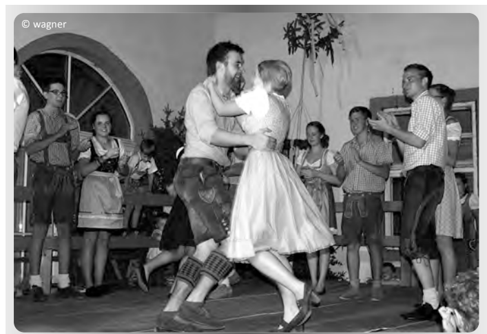
Tanzen und Feiern gehört selbstverständlich dazu!