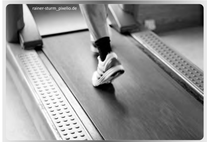
Bewegung fördert Gesundheit!

ger daran orientieren, welche neuen Fitnesstrends laut Studien am effektivsten sind oder am meisten Fett verbrennen, vielmehr sollten wir Sportarten betreiben, die uns wirklich Spaß machen. Dann kommt die Belohnung schon beim Sport machen und nicht erst hinterher. Wenn wir es dann noch schaffen, motivierende Ziele zu finden, zum Beispiel an einem Stadtlauf teilzunehmen oder eine neue Sportart zu lernen, stehen die Chancen für dauerhaft motivierte Bewegung gar nicht schlecht. (tk)