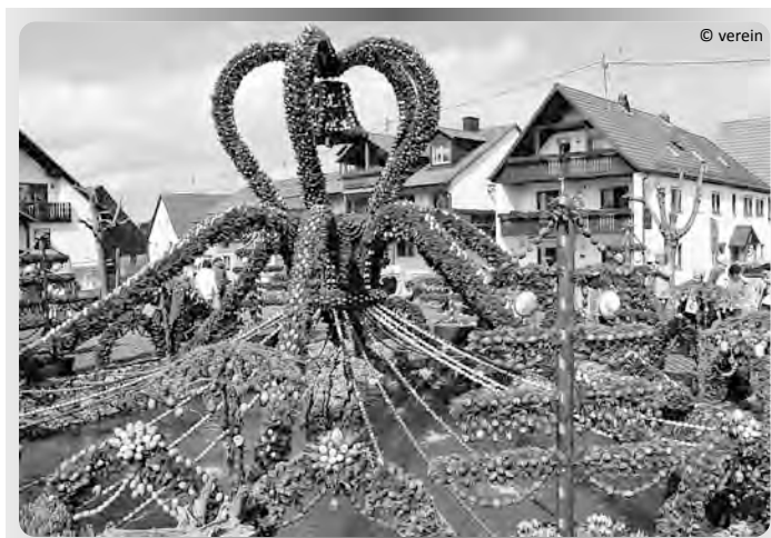
Der weltgrößte Osterbrunnen

Aktivitäten des VdK-Ortsverbands Ellingen: http://www.vdk.de/kv-weissenburg/ID42663 www.ellingen.de > Vereine > Vereine > VdK