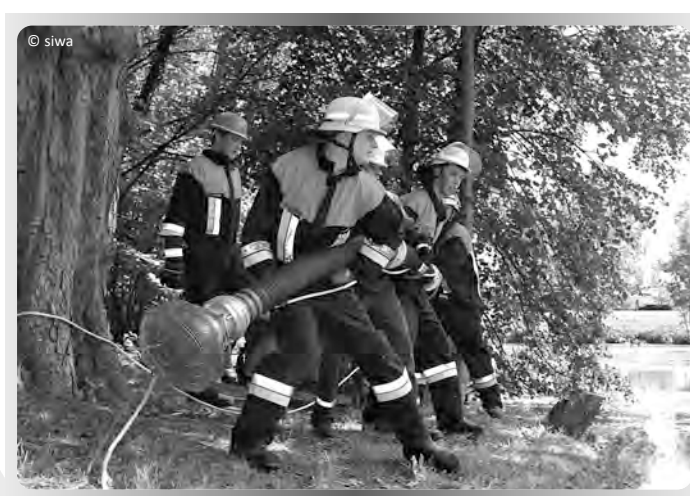
Leistungsschau der Jugendfeuerwehr Ellingen