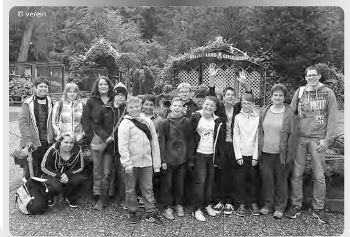
Gruppenbild vom Ausflug in den Freizeitpark Geiselwind

Der diesjährige UFC-Vereinsausflug in den Freizeitpark Geiselwind fand bei großen und kleinen UFClern positiven Anklang. In aller Früh fuhr die Gruppe mit dem Busunternehmen Engeler von der Grundschule in Ellingen ab, direkt zum Freizeitparkgelände nach Geiselwind. Nach einer ca. 1,5-stündigen Fahrt sowie der Ticketausgabe mit anschließendem obligatorischem Gruppenfoto stand dem Vergnügen nichts mehr im Wege. Die 18 Teilnehmer teilten sich in vier Kleingruppen auf. Und testeten im Anschluss die verschiedenen Attraktionen des Parks. Die „Fränkische Weinfahrt“ versetzte die Kids in gute Laune. Mittags trafen sich alle in der „Circus-Show“. Willkommener Höhepunkt war die Live-Show „Acapulco“, in der mutige Springer von bis zu 25 Meter Höhe in ein nur 3 Meter tiefes Becken sprangen. Am Nachmittag absolvierte die Gruppe die Hauptattraktionen des Tages, bis schließlich aufgrund des Regens um 16:40 Uhr vorzeitig die Rückkehr angetreten musste. Zur Feier des Tages gab es Popcorn für alle. Trotz des vielen Regens war es ein gelungener Tag. Der Dank des UFC Ellingen geht an Dominik Pfaller für's Organisieren sowie an die N-ergie AG für die finanzielle Unterstützung der Fahrt. (dpf)