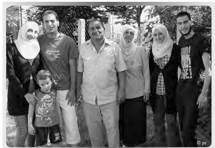
Gruppenbild im Garten

Nach- oder aufgeben wird man beim Helferkreis aber nicht, das ist sicher. Und so lange es an der Sprache hapert, wird eben mit Händen und Füßen erklärt und „gesprochen“, wo die Übersetzung nicht ausreicht. (al)