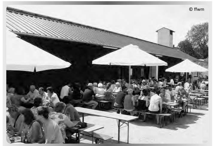
Feiern am Massenbacher Feuerwehrhaus