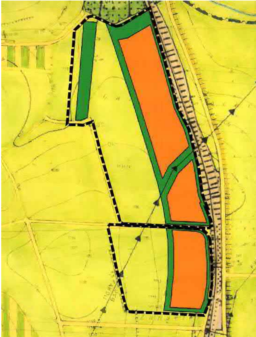
Auszug aus dem Flächennutzungsplan; Darstellung unmaßstäblich

Im rechtskräftigen Flächennutzungsplan der Stadt Ellingen ist die östliche Teilfläche bereits als Sondergebiet Photovoltaik mit randlichen Grünflächen ausgewiesen. Der Schutzstreifen unter der Hochspannungsleitung ist als Grünfläche ausgewiesen.