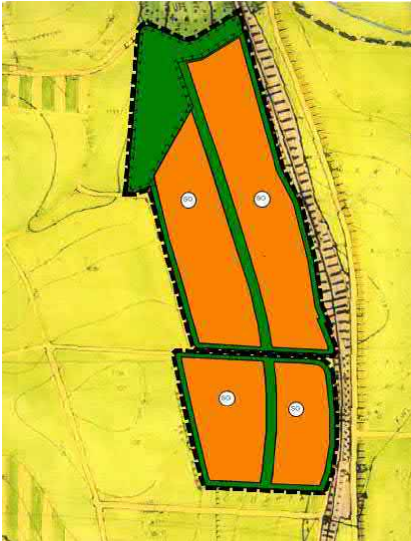
Änderung des Flächennutzungsplans, Ausweisung eines Sondergebiets für Photovoltaik

Gebiete für Anlagen, die der Erforschung, Entwicklung oder Nutzung erneuerbarer Energien wie Wind- und Sonnenenergie dienen, fallen nach Baunutzungsverordnung §11 (2) unter die Sonstigen Sondergebiete.