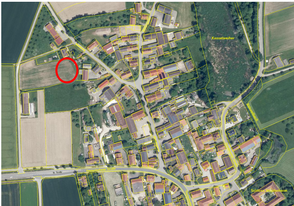
Auszug Bayern Atlas

Die Einbeziehungssatzung arrondiert den nordwestlichen Ortsrand von Stopfenheim